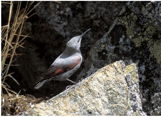
Autor - Javier Ara