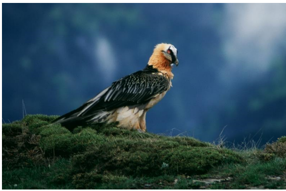
Autor - Eduardo Viñuales